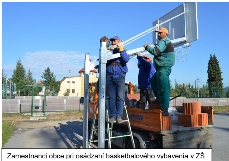
Zamestnanci obce pri osádzaní basketbalového vybavenia v ZŠ

Bola ukončená rekonštrukcia tribúny na futbalom ihrisku, na ktorej zamestnanci obce vymenili drevené lavice za plastové sedačky, ktoré obec zakúpila z futbalového štadióna Tatran Prešov, ktorý je rekonštruovaný. V obci sa začalo s výstavbou cyklochodníka, ktorý začína od chodníka pri št. ceste I/18 (Prešovská ul.) a končiť bude na Hamzovej ul. vedľa futbalového štadióna. Stavbu realizuje úspešný uchádzač z verejného obstarávania, a to spoločnosť STELL s.r.o. Vranov n/T. Na tento projekt poskytol dotáciu Úrad vlády Slovenskej republiky.