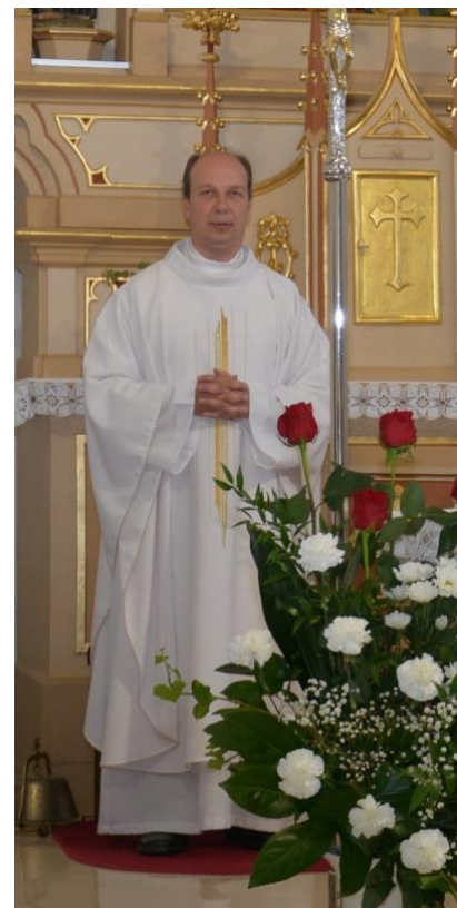
Spracovala: Bc. Anna Reváková

Za úprimné slová ďakujeme a vyprosujeme hojnosť Božích milostí.