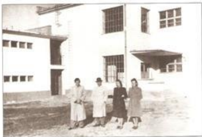
Obecná ľudová škola postavená v r. 1939