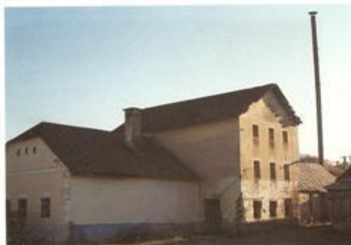
Hore Virbov mlyn, dolu Parný mlyn