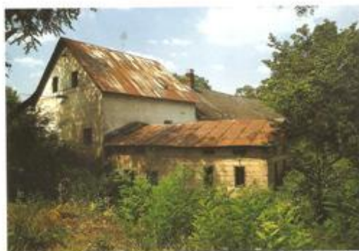
▲ Budova narkádzateľného mlyna (19. storočie)