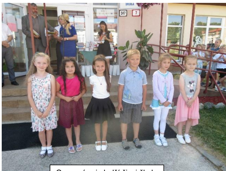
Ocenení najmladší žiaci školy

Spomeňme aj žiakov, ktorí mali 0 vymeškaných hodín. Sú to: