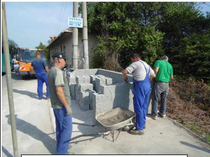
Vybudovanie nových autobusových zastávok

Obci Bystré bola schválená žiadosť o poskytnutí nenávratného finančného príspevku na projekt pod názvom "Zníženie energetickej náročnosti verejnej budovy – Budova obecného úradu obce Bystré", t. j. zateplenie budovy, výmena kúrenia, vchodových dverí a vybudovanie bezbariérového vstupu, vo výške 166 094,87.- €. Celkové