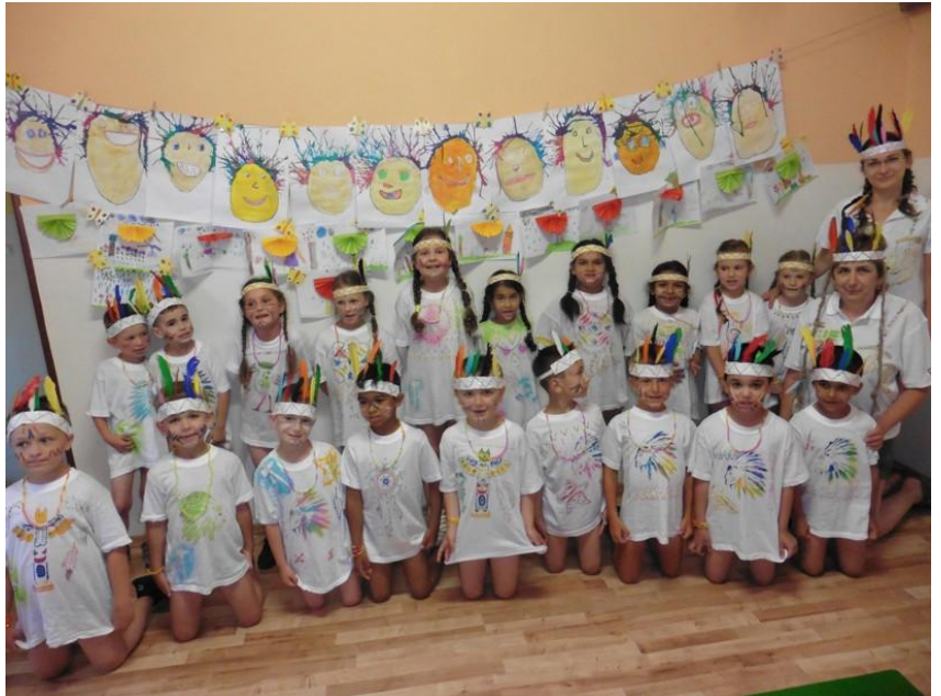
Deti z MŠ Bystré Sídliisko 311

Školský rok sa končil v mesiaci jún a ten bol v našej materskej škole plný aktivít. Už prvý deň v tomto mesiaci začal oslavou. Oslavovali sme Medzinárodný deň detí. Mali sme na návštevu svojich kamarátov z Materskej školy 172 a spolu sme zdieľali športové stánovištia. Bolo to náročné, ale odmena stála za to. Pán starosta s pánom zástupcom nám odovzdali darčeky, ktoré boli zakúpené z obce a nechýbali ani členovia DHZ v Bystrom, ktorí nám predviedli technické vybavenie hasičských áut a aj traktor z obce. Po oslave nášho sviatku začali prípravy na školský výlet a predškolačky sa pripravovali na veľký deň - „Rozlúčku s materskou školou“. Tento deň sa trieda predškolákov spolu s nami premenila na indiánsky tábor, ktorý obsahoval všetko, čo v ozajstnom tábore má byť. Počasie nám prialo, takže sme si ten deň mohli naplno vychutnať. V závere dňa sme si dali „indiánsku večeru“ a výbornú tortu, s ktorou sme ponúkli aj rodičov, ktorí si nás vyzdvihli z materskej školy, keď už bola ozajstná tma. Ani v tento deň sme neodchádzali z materskej školy s prázdnyimi rukami. Poklad, ktorý sme našli, sme si rozdelili a s indiánskym tričkom sme odchádzali plní zážitkov domov na posledné „škôlkarské“ prázdniny.