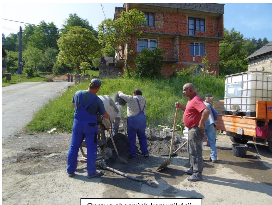
Oprava obecných komunikácií

Bolo vytvorených 12 pracovných miest na dobu 15 mesiacov, pričom príspevok je vo výške 90 457,80.- €.