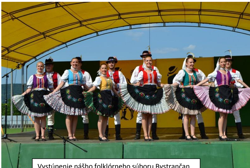
Vvstúpenie nášho folklórneho súboru Bvstrančan

V nedeľu po raňajkách sme hosťom odovzdali balíčky na dlhú cestu a rozlúčili sme sa, ale iba na ďalšie dva roky. Toto stretnutie v nás opäť zanechalo kopec krásnych, veselých momentov a spomienok. Bolo veľmi fajn vidieť, ako sa vieme spolu zabaviť, zasmiať, zasúťažiť si. Už teraz sa veľmi tešíme na ďalšie stretnutie.