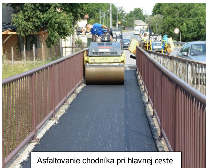
Asfaltovanie chodníka pri hlavnej ceste

výdavky projektu sú vo výške 174 789,34.- €.