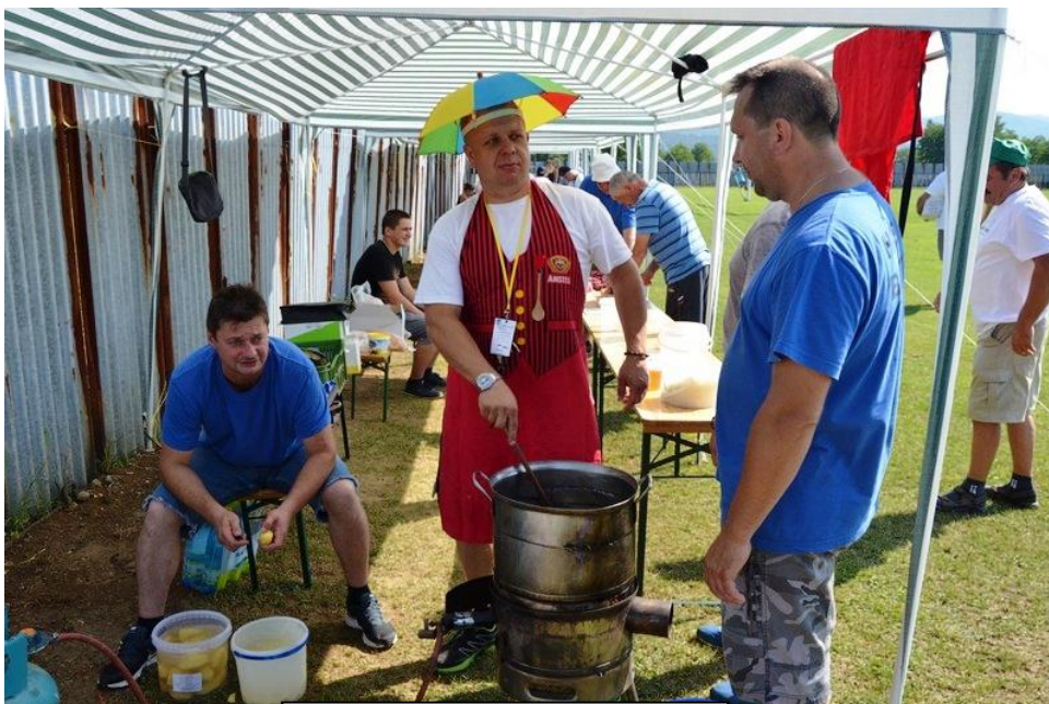
Naši hasiči pri príprave guľášu

V nedeľu po raňajkách sme hosťom odovzdali balíčky na dlhú cestu a rozlúčili sme sa, ale iba na ďalšie dva roky. Toto stretnutie v nás opäť zanechalo kopec krásnych, veselých momentov a spomienok. Bolo veľmi fajn vidieť, ako sa vieme spolu zabaviť, zasmiať, zasúťažiť si. Už teraz sa veľmi tešíme na ďalšie stretnutie.