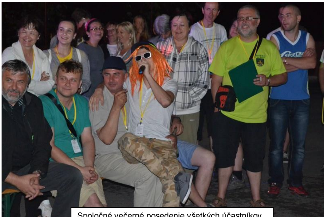
Spoločné večerné posedenie všetkých účastníkov

Stretnutie začalo v piatok približne o 17. hodine, a to v Komunitnom centre, kde sme ich srdečne privítali. Tu