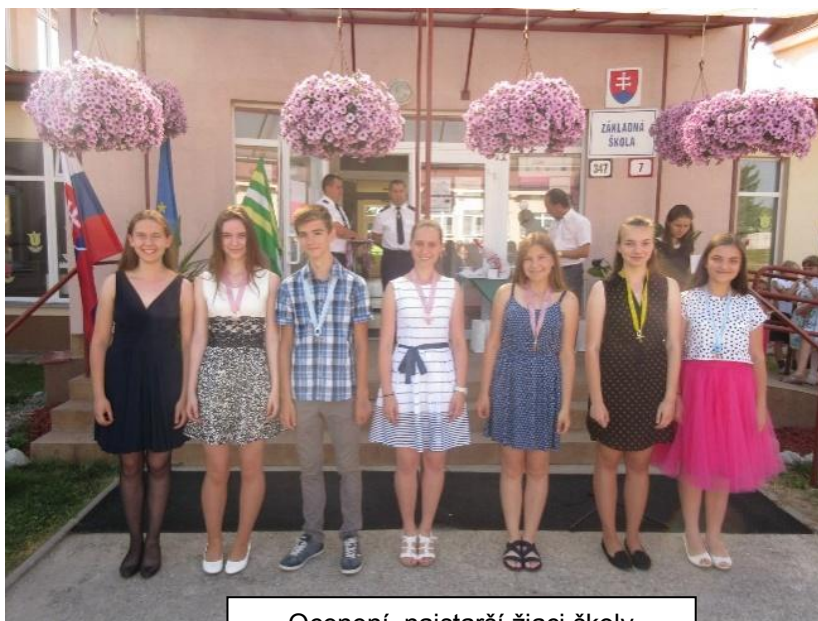
Ocenení najstarší žiaci školy