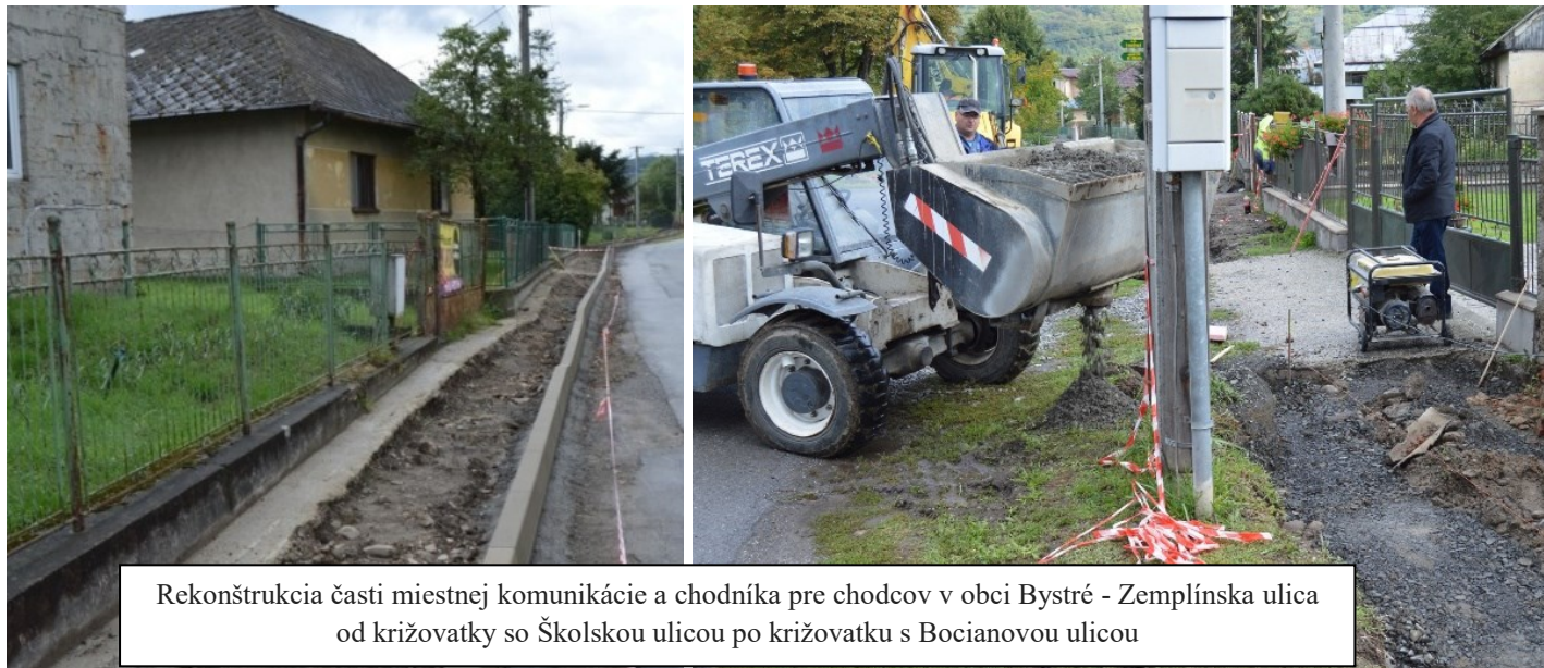
Rekonštrukcia časti miestnej komunikácie a chodníka pre chodcov v obci Bystré - Zemplínska ulica od križovatky so Školskou ulicou po križovatku s Bocianovou ulicou

Úspešný uchádzač z verejného obstarávania, spoločnosť Mourez s. r. o. Vranov n/T., začala po opakovaných vyjednávaniach (pri verejnom obstarávaní znížila cenu o 24 % a následne žiadala cenu navýšiť z dôvodu rastu cien stavebných materiálov) so stavebnými prácami na projekte s názvom „Zlepšenie dopravnej a technickej vybavenosti obce Bystré“, na ktorý obec dostala dotáciu z Ministerstva investícií, regionálneho rozvoja a informatizácie SR, pričom bude zrekonštruovaná časť Zemplínskej ulice, a to od križovatky so Školskou ulicou po križovatku s Bocianovou ulicou, a taktiež bude na uvedenom úseku zrekonštruovaný aj chodník pre chodcov.