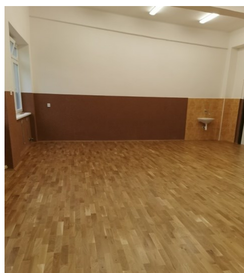
Príprava kybernetickej učebne