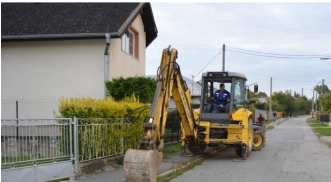
Rekonštrukcia časti miestnej komunikácie v obci Bystré - Šarišská ulica od polyfunkčného domu Poloma po križovatku s Bocianovou ulicou

Obec má problémy pri projektoch s názvami Modernizácia domu smútku a Modernizácia detského dopravného ihriska v MŠ Bystré 172. Úspešní uchádzači z verejného obstarávania neprevzali stavby kvôli nárastu cien stavebných materiálov, taktiež pri projekte detského ihriska Rodinka v areáli športoviska Dreveňák sa ani na druhý pokus neprihlásil žiadny uchádzač, ktorý by