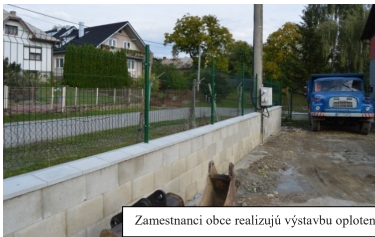
Zamestnanci obce realizujú výstavbu oplotenia okolo garáží obecného dvora

Obec Bystré dňa 24. júla 2022 v spolupráci s Poľovníckym združením Topľa Bystré zorganizovala 8. ročník športovo-turistickej akcie pod názvom „ŠčevicaTour 2022“, 05. augusta zorganizovala 30. ročník nohejbalového turnaja pod názvom „Ščevica Cup 2022“, 20. augusta zorganizovala 21. ročník basketbalového turnaja „Streetball Ščevica“, v dňoch 26. a 27. augusta v spolupráci s obcami Hermanovce nad Topľou, Čierne nad Topľou, Zlatník a spoločnosťou Zeocem, a. s. Bystré a Agrodružstvo Bystré zorganizovala 42. ročník „Výstupu na Šimonku“, 29. augusta v spolupráci s Rímskokatolíckou farnosťou sv. Urbana zorganizovala na záver leta podujatie s názvom „Prázdninová bodka“ a 24. septembra v spolupráci s Dobrovoľným hasičským zborom zorganizovala 3. ročník súťaže „O najlepšiu guľáš“.