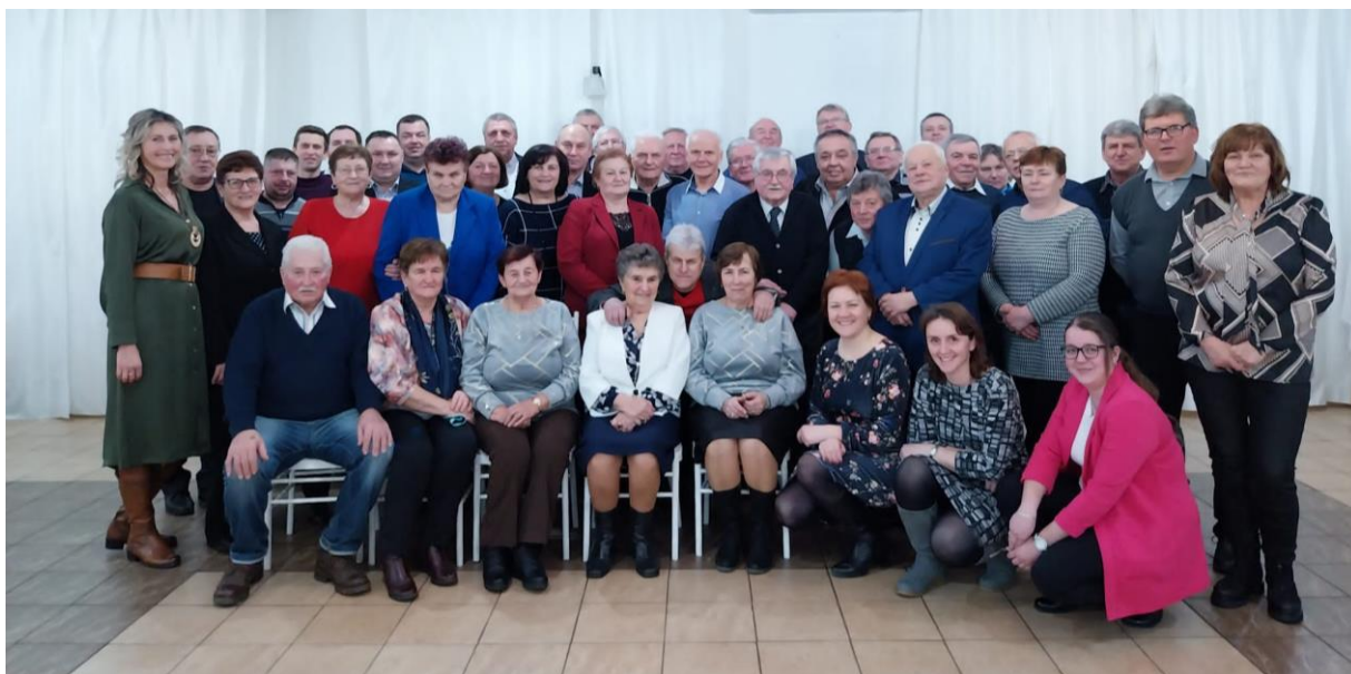
Foto: Stretnutie všetkých bývalých a súčasných THP pracovníkov a členov predstavenstva Agrodružstva Bystré v januári 2024

Živočíšna výroba je zameraná na chov hovädzieho dobytká a oviec. Chov hovädzieho dobytká je sústredený na hospodárskom dvore Čierne n/T. Spolu chováme cca 400 kusov hovädzieho dobytká, pričom polovicu tvoria dojnice a zvyšok jalovice, teľatá a býky do 1 roka. Dojnice sú výlučne plemena slovenský strakatý dobytok, ktorého máme uznaný šľachtiteľský chov. Čo sa týka úžitkovosti patrime medzi podniky s najvyššou dojivosťou dosahovanou u tohto plemena na Slovensku. Chov oviec je sústredený na hospodárskom dvore v Hermanovciach n/T. a stavy oviec sa pohybujú okolo 550 kusov. Je zameraný na predaj ovčieho mlieka a jahniat. Keďže máme uznaný šľachtiteľský chov aj u oviec, časť tržieb plynie aj z predaja plemenných baranov. V chove oviec sme mali v dôsledku generačnej výmeny problémy s ošetrovateľmi oviec, čo sa prejavilo na poklese úžitkovosti. V súčasnosti sa situácia postupne stabilizuje.