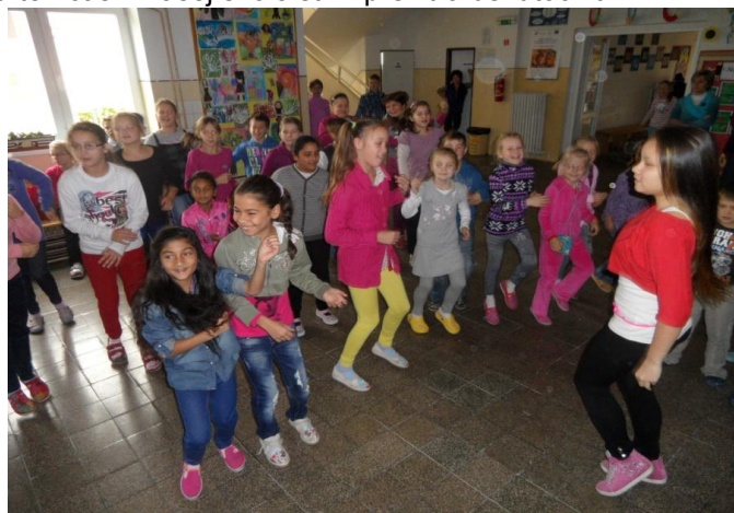
Tanečný maratón a naše deti

Rovnako obľúbené sú aj tvorivé popoludnia, kde žiaci spolu s rodičmi vyrábajú výrobky do Vianočnej burzy , ktorú každoročne organizujeme a získané peniaze používame na nákup kníh do školskej knižnice. Vydarený bol aj Mikulášsky deň . Žiaci si v anglickom a nemeckom jazyku pripravili piesne, vinše a vianočné príbehy. Poslednou akciou v kalendárnom roku je Vianočná akadémia , počas ktorej sa všetci snažíme pripraviť na prichádzajúce sviatky.