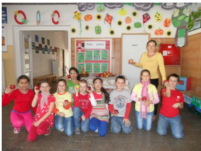
Veselo bolo aj na Deň jablák v škole