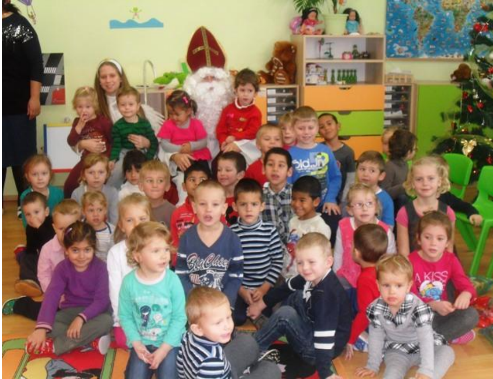
Medzi deti do škôlky zavítal Mikuláš s anjlikom

„Počúvajte všetci, veľkí, maličkí. Do okien si dajte čisté čižmičky, dnes večer k nám príde naozajstný živý Mikuláš...“