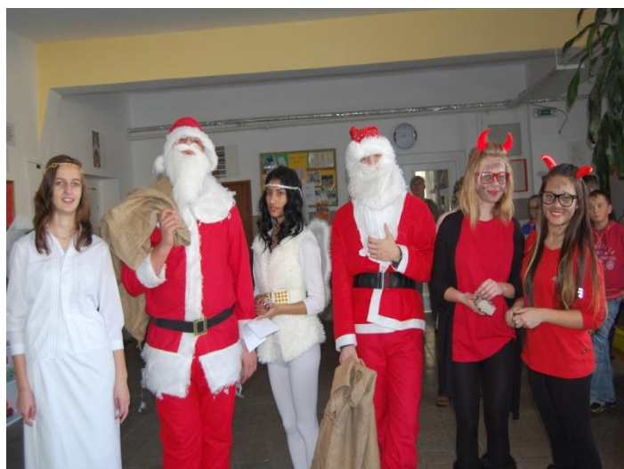
Do našej školy zavítal Mikuláš...