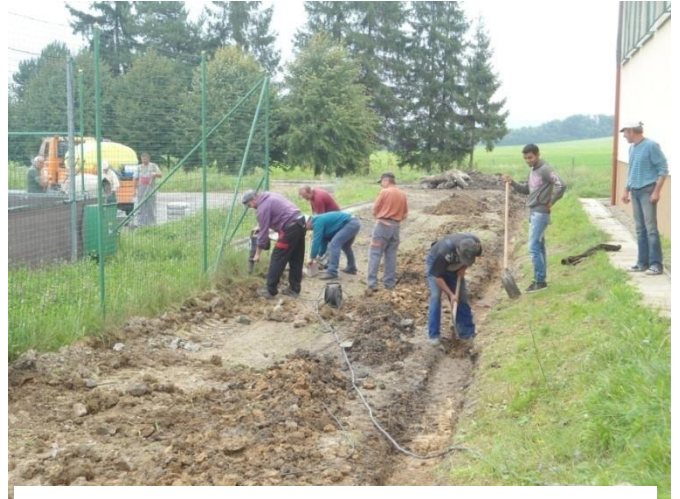
Pracovníci obecného úradu pri úprave plôch pri Základnej škole.