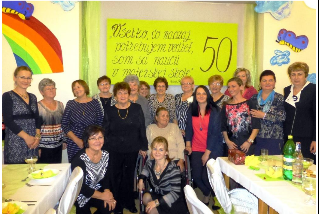
Kolektív bývalých a terajších učiteliek a pracovníčok v MŠ 311