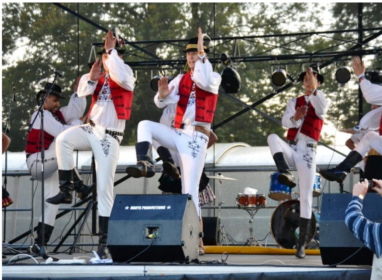
vystúpenie chlapcov zo súboru Bystrančan