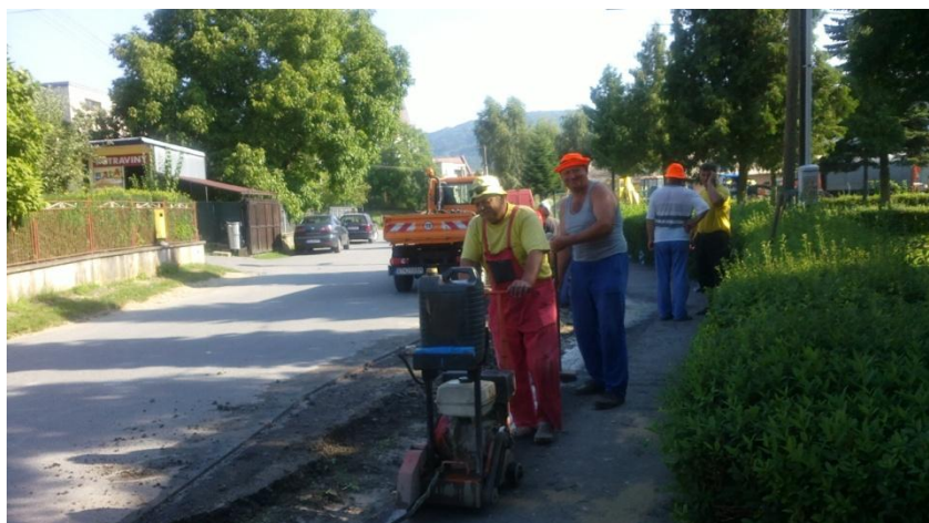
Oprava chodníkov pred budovou obecného úradu