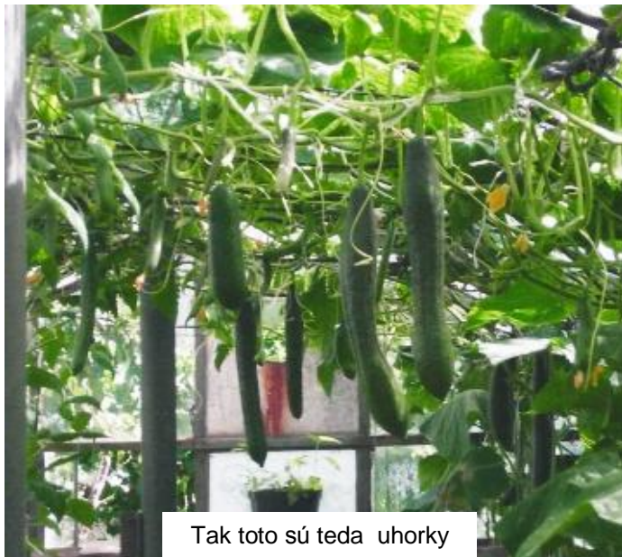
Tak toto sú teda uhorky

Vrúbľovanie sa robí preto, že tekvica má v porovnaní s uhorkami podstatne rozvinutejší koreňový systém. Jej hrubšie korene prenikajú hlboko do pôdy a ľahšie nachádzajú vodu a živiny. Zaštepene uhorky rastú bujnejšie, majú väčšie nehorknúce plody a sú veľmi chutné. Pri vrúbľovaní postupujeme takto: 1. Osivo uhoriek vysejeme o týždeň skôr ako osivo tekvice. Výsev robíme do malých kvetináčov, v ktorých máme pripravený záhradkársky perlit. 2. Optimálne obdobie na vrúbľovanie je štádium plne vyvinutých klíčnych lístkov a začínajúca sa tvorba prvého pravého listu. 3. Vrúbľujeme takto - obe rastlinky vyberieme zo zeme. Rez na tekvici režeme zhora dole asi do dvoch tretín hrúbky byliny. Rez na uhorky režeme zdola nahor. Potom vrúbeľ uhorky zasunieme do zárezu tekvice. Obe rastlinky spojíme klipsou ( sponkou ), alebo ovijeme páskou a zaštepene rastliny znova zasadíme do črepníka naplneného zeminou. 4. Zaštepene rastlinkám zabezpečíme na ďalších desať dní dobrú vzdušnú vlhkosť vytvorením minifóliovníka, čiže prekryjeme ich priesvitnou fóliou. 5. Asi po 10 dňoch, keď podnož tekvice vrúbľom uhorky zrastie ( poznáte to podľa toho, že list uhorky začína znova rásť ), odrežte vrchol tekvice a asi o týždeň odrežte pod navrúbľovaným miestom koreň uhorky a nechajte ho v črepníku. Na vrúbľovanie uhoriek s tekvicou odporúčam semená tekvice SPRINTER F1 alebo tekvice figolistej a semená uhoriek SUPERSTAR F1 alebo TRIGUTER. A to je na teraz asi všetko. Ďakujem za rozhovor a prajem všetko dobré.